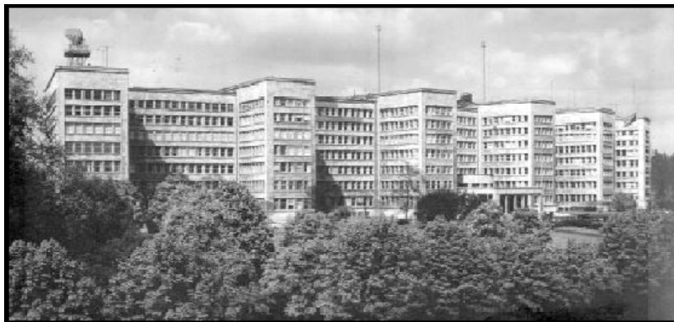
Фиг.1. Сградата на централата на IG Farben във Франкфурт на Майн.

(Сградата е с дължина 250 m, височина 35 m, обем от 280 000 m 3 , полезна площ от 25 000 m 2 и до 50-те години е една от най-големите и модерни сгради в Европа.) Построена е по проект на известния немски архитект Ханс Пьолциг през 1930 г. По време на окупацията на Германия в сградата е разположено командването на американските войски — генерал Дуайт Айзенхауер. От 1952 г. служи като Европейска централа на Американското военно командване. След обединението на Германия и изтеглянето на американските войски от Германия, по решение на Правителството на Хесен, сградата е предоставена на Университета Йохан-Волфганг Гьоте.